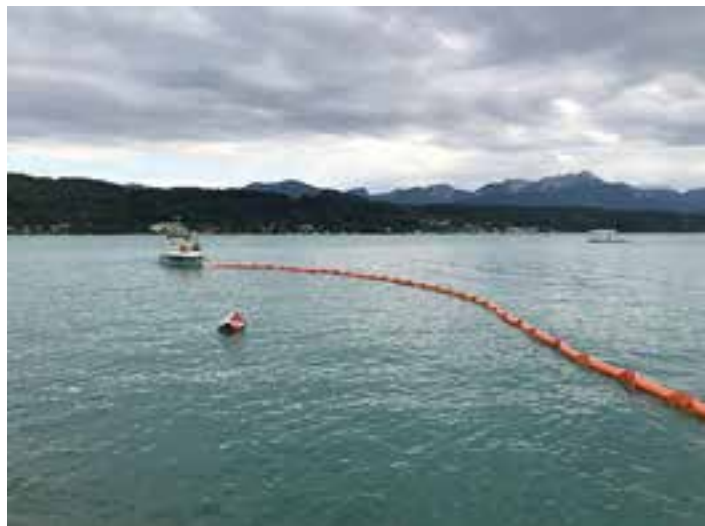
Errichten der Ölsperre

Da die ÖWR Einsatzstelle Bad Saag in der Gemeinde Techels-