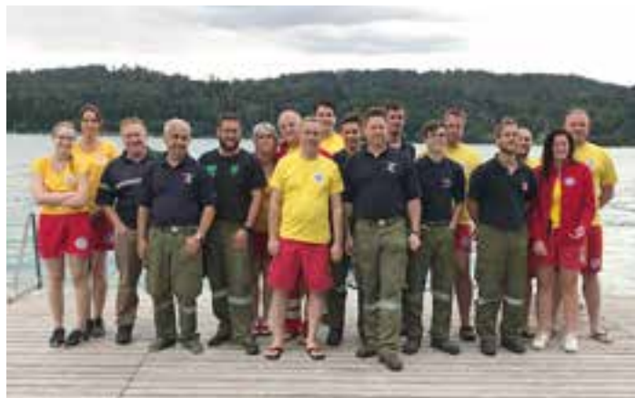
FFW Töschling und ÖWR Bad Saag

berg am Wörther See beheimatet ist, ist es naheliegend, dass wir gemeinsam mit Kräften der ortsansässigen Freiwilligen Feuerwehren üben. Zu den Kameraden der FFW Töschling haben wir in den vergangenen Jahren durch gemeinsame Veranstaltungen wie das Christbaumversenken die Kameradschaft bis zur Freundschaft weiterentwickelt. Gemeinsame Übungen geben jeweils bessere Einblicke in das Agieren des Anderen, gemeinsam werden wir im Notfall noch stärker.