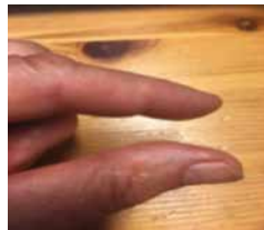
Pinzettengriff = Der Kranke kann noch selbständig essen und trinken

Die Griffe müssen vom Betroffenen selbständig gemacht und dürfen nicht vorgezeigt werden.