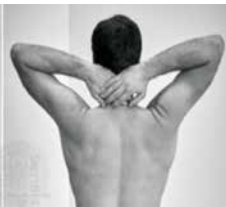
Nackengriff = Er kann sich noch allein anziehen