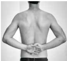
Schürzengriff = Selbstreinigung auf der Toilette

Erstbegutachtung: Der Angehörige darf bei der gesamten Aufnahme dabei sein. Der Gutachter ist verpflichtet, dies zuzulassen. §25 Bundespflegegeldgesetz: Auf Wunsch des Pflegebedürftigen oder seines gesetzlichen Vertreters ist bei der Untersuchung die Anwesenheit und die Anhörung einer Person seines Vertrauens zu ermöglichen. Halten Sie alle ärztlichen Befunde bereit; angeblich erhält der Gutachter vom Entscheidungsträger diese nicht. Um u.a. die Mobilität und die kognitiven Fähigkeiten festzustellen, werden vom Sachverständigen folgende Griffe verlangt: