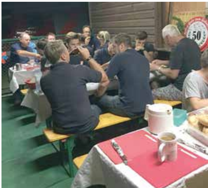
Die Jugendfeuerwehr hat einige Übungen durchgeführt und natürlich auch gemeinsame Ausflüge.