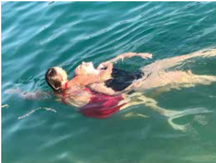
Helfer- und Retterkurs in Bad Saag

Ein Kurs für zukünftige Rettungsschwimmer wurde an sieben aufeinanderfolgenden Tagen, jeweils von 18.00 bis 20.00 abgehalten (27.7. bis 4.8.). Die Prüfungen für den Helfer- bzw. Retterschein wurde von den Kandidaten mit Erfolg abgelegt.